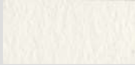
1402 Chinesisch Weiß *** Chinese White Blanc de Chine