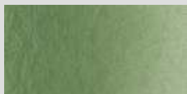
1438 Chromgrün oliv *** Olive Green Vert olive