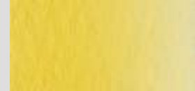
1410 Indischgelb *** Indian Yellow Jaune indien