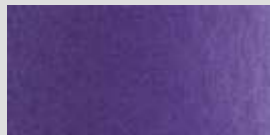
1432 Violett ** Violet Violet