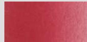
1418 Krapplack ** Alizarin Crimson Alizarine cramoisie