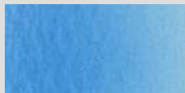
1428 Cyan (Primäre) *** Cyan (Primary Blue) Bleu primaire (Cyan)