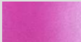
1416 Magenta (Primäre) ** Magenta (Primary Red) Rouge prim. (Magenta)