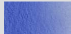
1434 Ultramarinblau *** Ultramarine Outremer