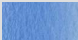
1436 Kobaltblau (Phthalo) *** Cobalt Blue (Phthalo) Bleu de cobalt (phthalo)